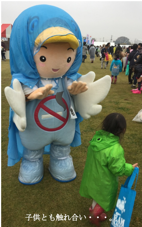
子供とも触れ合い・・・。