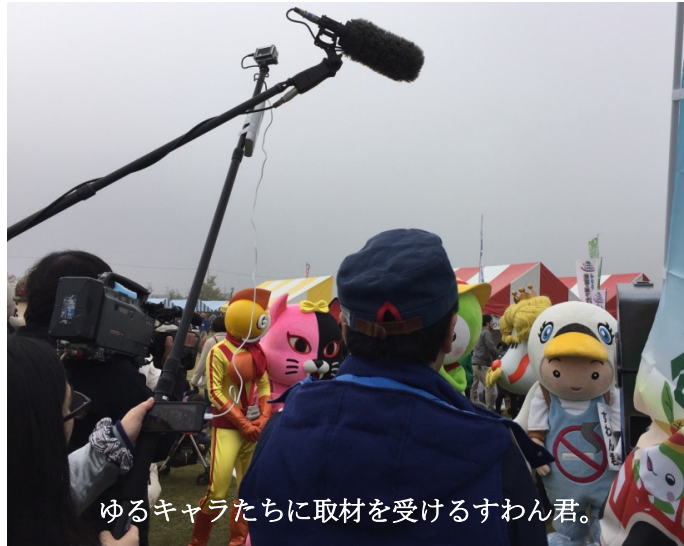
ゆるキャラたちに取材を受けるすわん君。