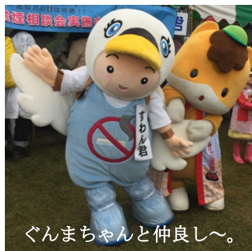
ぐんまちゃんと仲良し～。