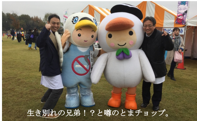
生き別れの兄弟！？と噂のとまチョップ。