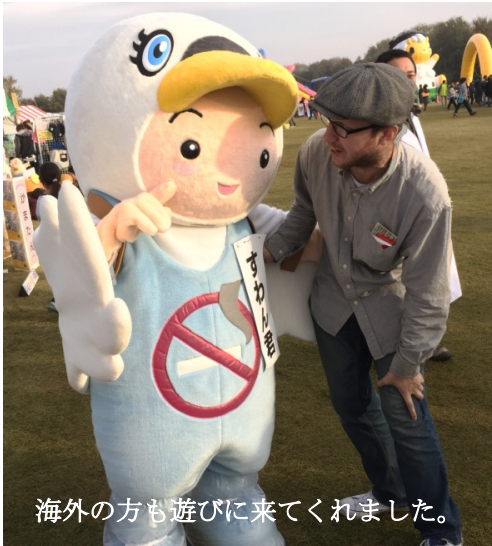
海外の方も遊びに来てくれました。

このような多くの人が集まる場所へ出向き、一般市民の方々が何を思い、何を感じているのかを先生方が参加することで、より理解できると考えます。また、頂きました様々なご意見を、今後の活動に活かしていきたいと今後も禁煙推進委員会は活動してまいります。