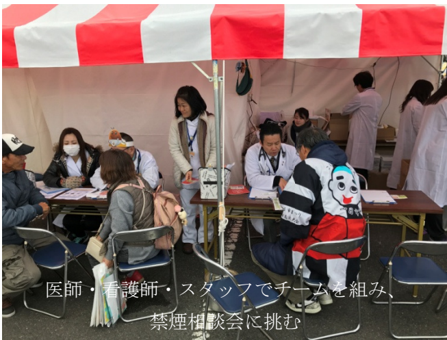
医師・看護師・スタッフでチームを組み、 禁煙相談会に挑む