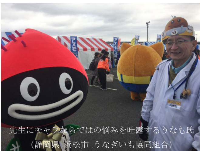
先生にキャラならではの悩みを吐露するうなも氏 (静岡県 浜松市 うなぎいも協同組合)