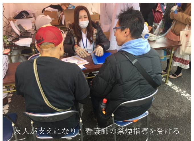
友人が支えになり、看護師の禁煙指導を受ける