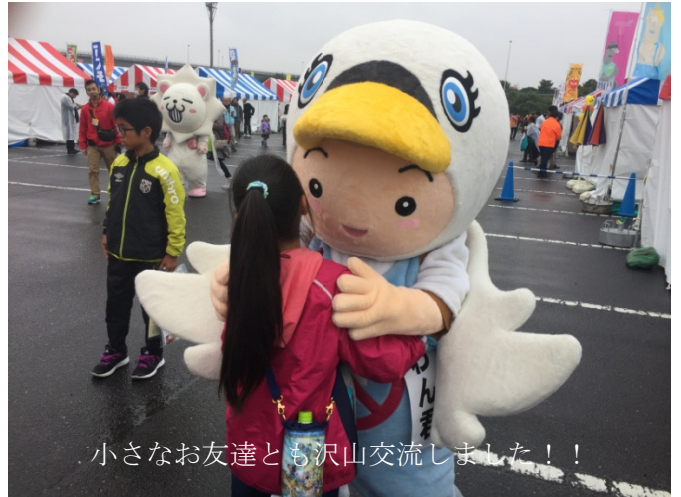
小さな友達とも沢山交流しました！！